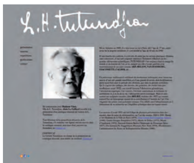
Vue du site internet actuellement en ligne.

Un don de 4 000€ couvre le fonctionnement annuel du site.