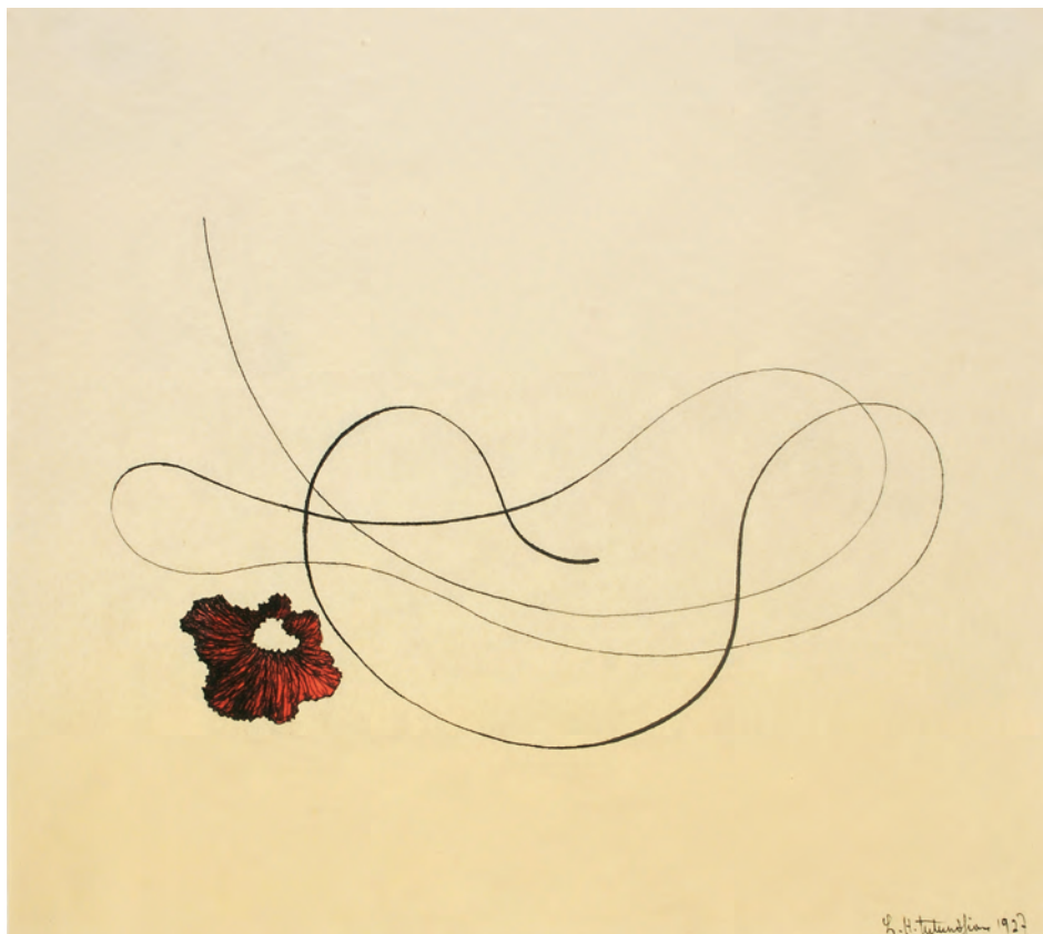
Sans titre , 1927, gouache et encre de chine sur papier. Collection privée