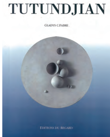
Couverture de Tutundjian , monographie de Gladys Fabre, éditée en 1994 aux Editions du Regard.

Un don de 50 000€ fera de vous l'unique mécène du nouvel ouvrage. Un don de 10 000€ vous permettra d'être l'un des cinq mécènes de l'ouvrage.