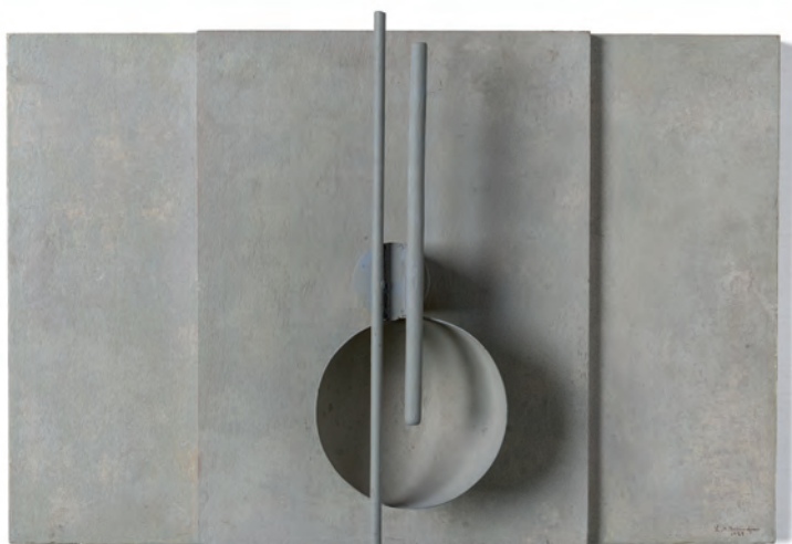
Relief exposé à Institut Valencià d'Art Modern, Valence (Espagne) dans le cadre de l'exposition Paris 1930. Art abstrait-Art concret , commissariat général : Gladys Fabre. Sans titre , 1929, bois et métal peints, 29 x 43,8 cm. IVAM - Centre Julio Gonzalez.