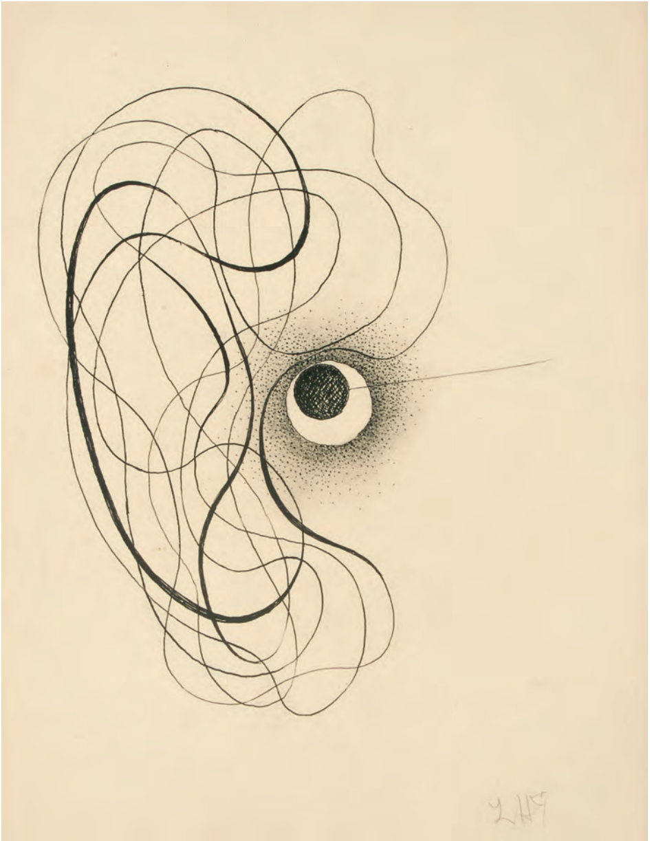
Sans titre , 1927, encre de chine sur papier, 23,5 x 18 cm.