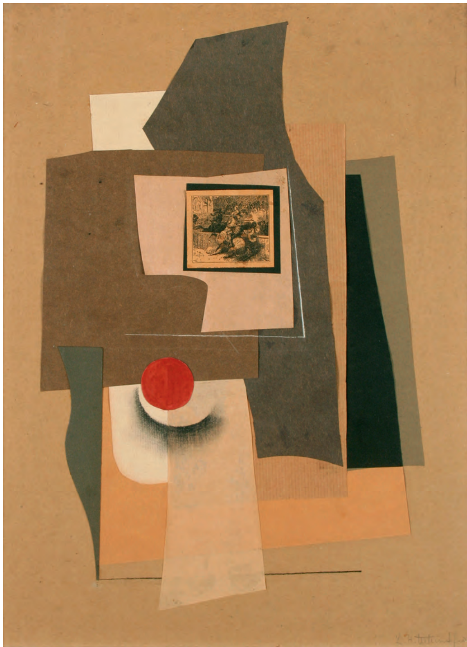
Sans titre , 1925-1926, collage, encre de chine sur papier, 42 x 31 cm. Collection privée.